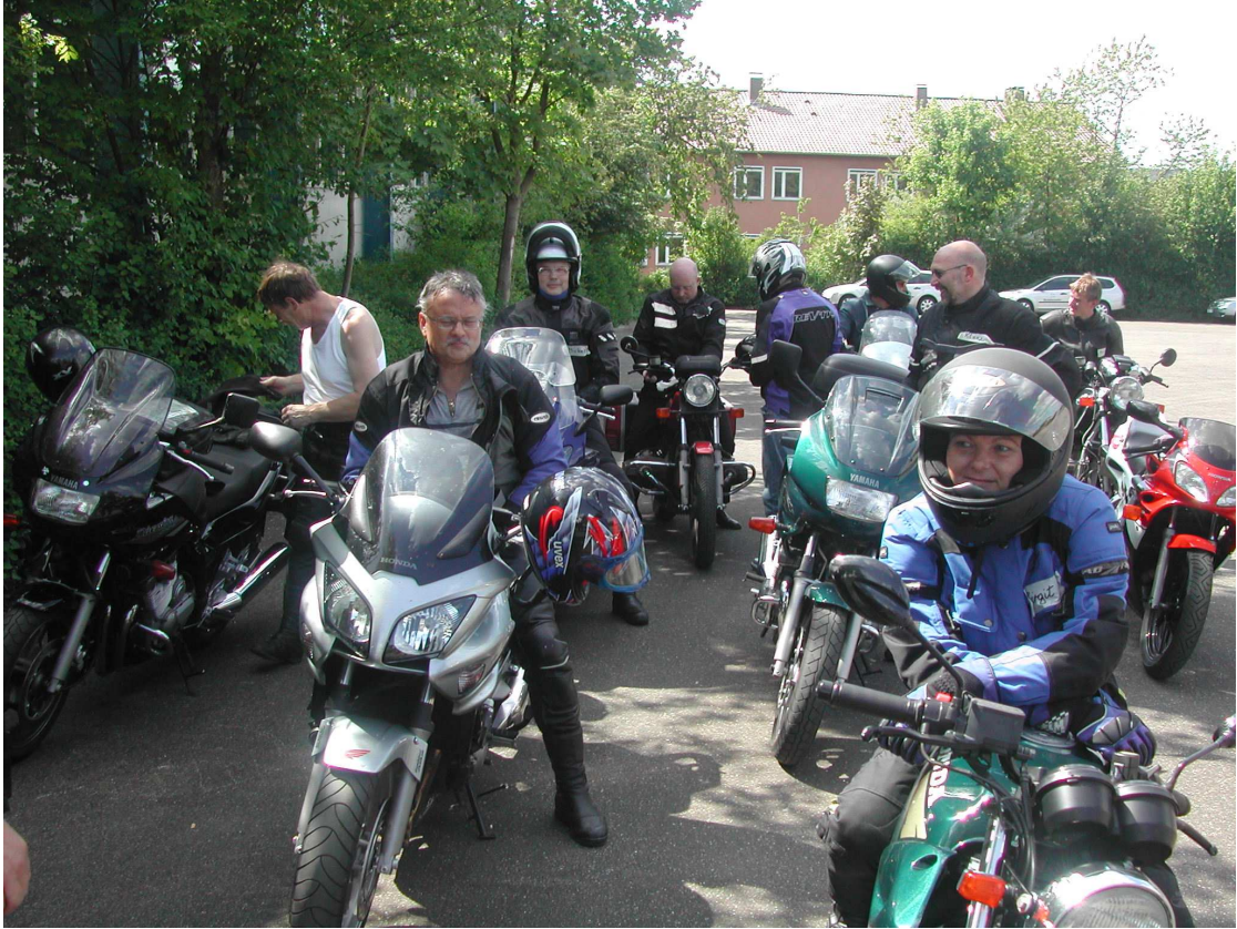
Sicherheitstraining Motorrad – unverändert beliebt