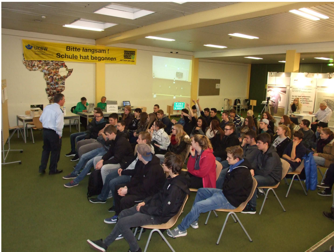
Polizei und Verkehrswacht gemeinsam im Sinne der Verkehrssicherheit