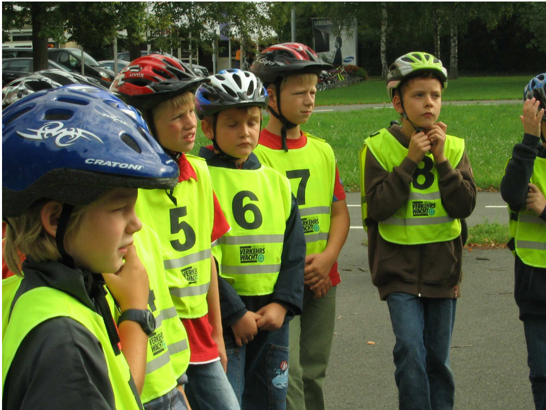
Grundschüler bei der Fahrradprüfung

All diese Aufgaben werden uns auch im Jahr 2016 und in der Zukunft beschäftigen. Für die bisherige Hilfe danken wir allen Mitgliedern, Freunden und Partnern recht herzlich und dürfen diesen Dank mit der Hoffnung auf künftige wohlwollende Unterstützung verbinden.