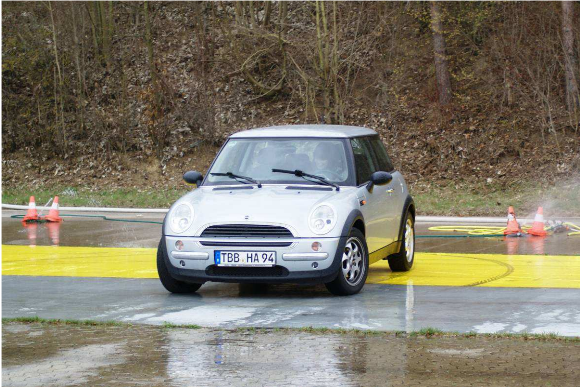
Sicherheitstraining PKW – Bremsen und Ausweichen muss geübt werden

Fest in das Angebot unserer Verkehrswacht verankert sind die nach wie vor beliebten Sicherheitstrainingskurse. Hier wurden im Berichtszeitraum 34 Kurse für PKW mit 329 Teilnehmern und 10 Kurse für Motorradfahrer mit insgesamt 77 Teilnehmern durchgeführt. Wieder im Angebot war auch eine Veranstaltung des zweitägigen mobilen Motorradsicherheitskurses im Rahmen der „German Safety Tour“.